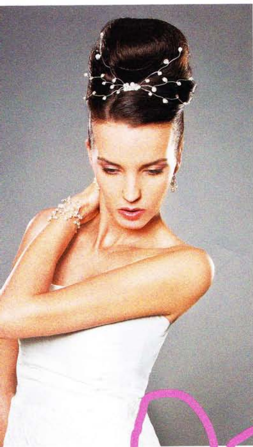
Haare & Make-up Lupo :: Fotos Klaudia Taday :: Schmuck Colloares :: Fashion Styling Milla Miska Clothing