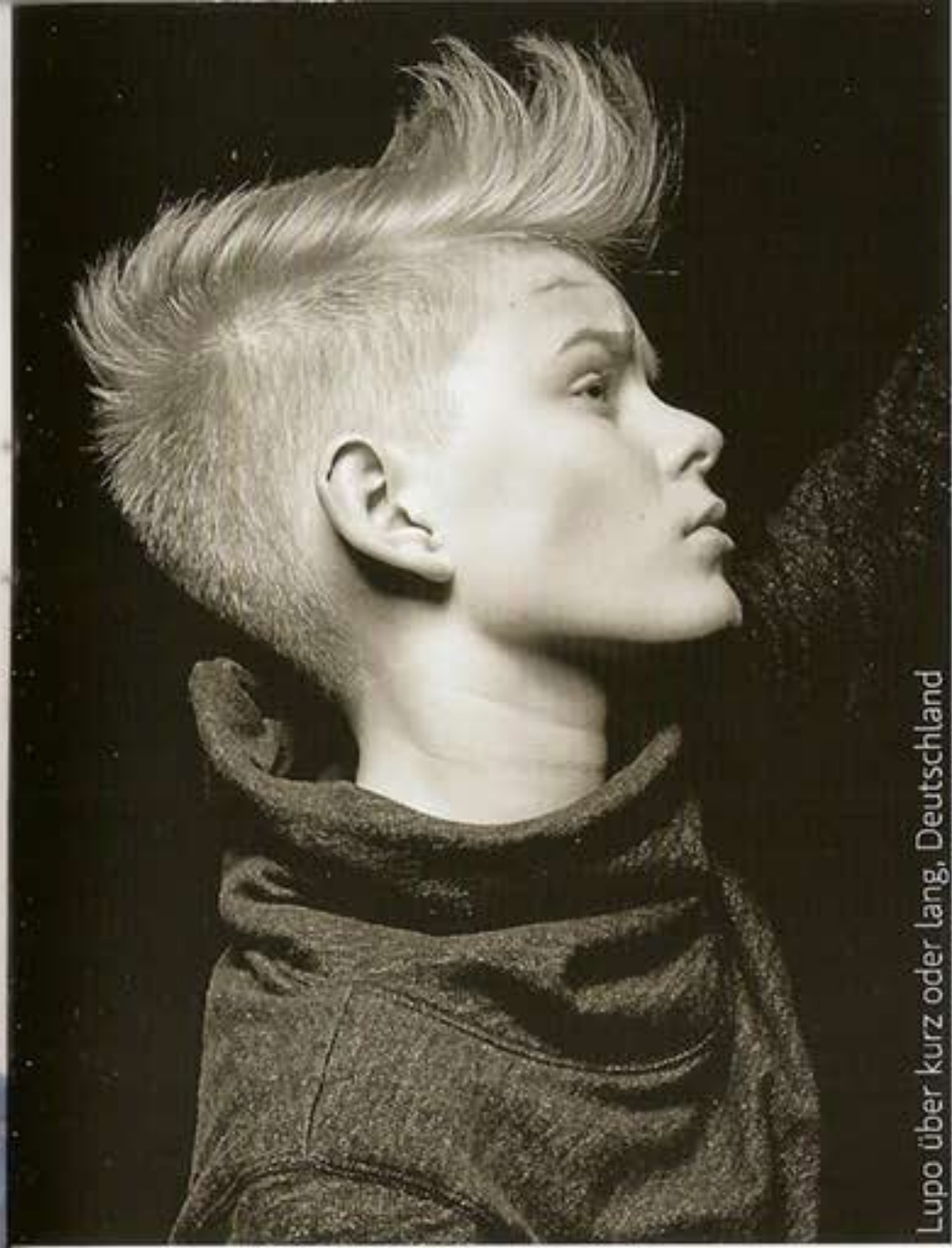
Lupo über kurz oder lang, Deutschland