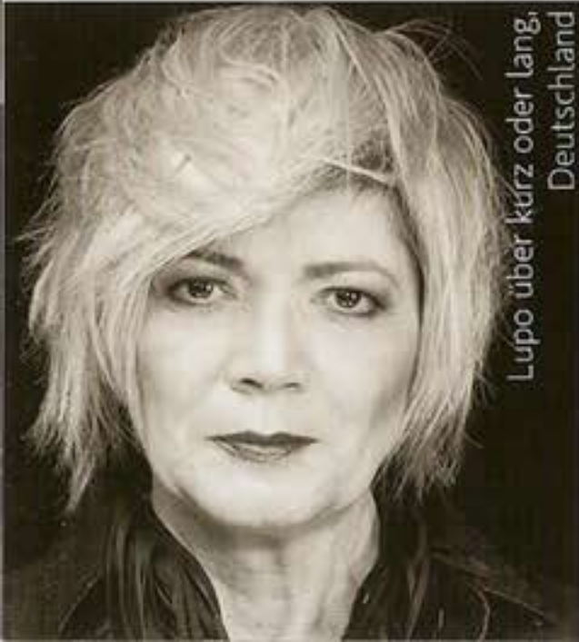
Lupo über kurz oder lang, Deutschland