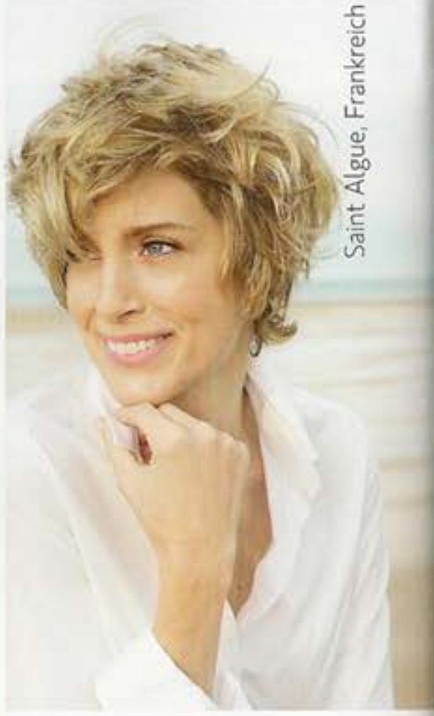
Saint Algue, Frankreich