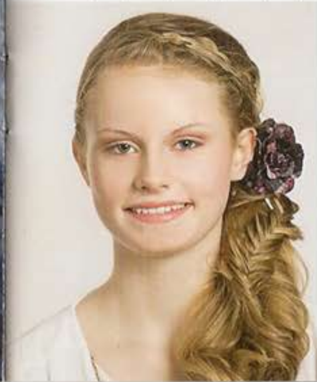
Lupo über kurz oder lang, Deutschland