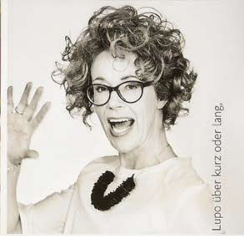
Lupo über kurz oder lang,