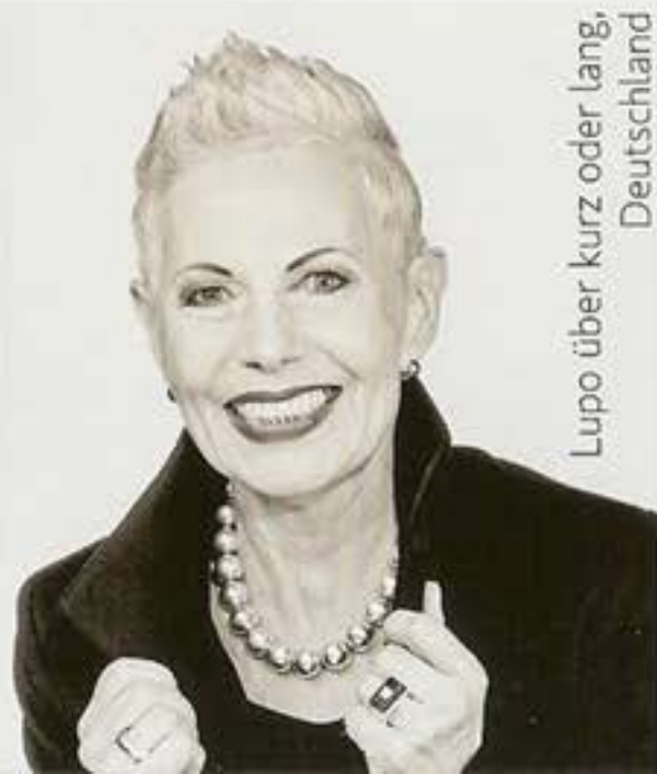
Lupo über kurz oder lang, Deutschland