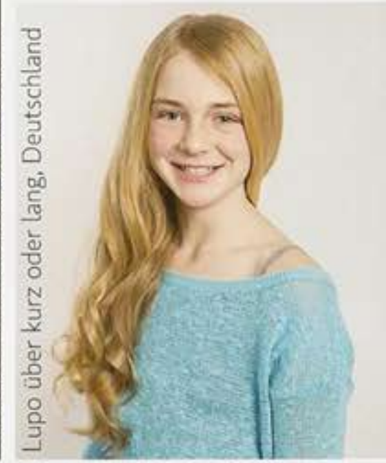
Lupo über kurz oder lang, Deutschland